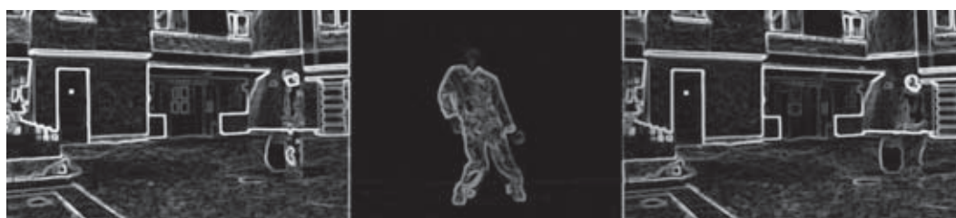
Spectacle Proximité Cie Aktuel Force