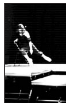
Spectacle Proximité Cie Aktuel Force